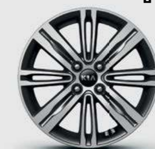
חישוק סטנדרט 16"